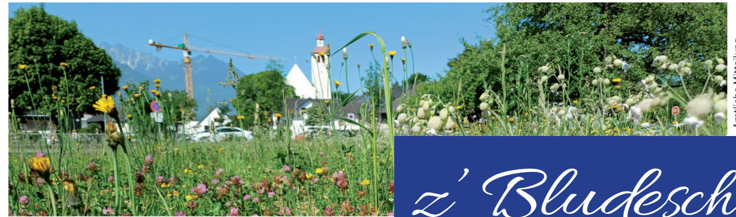
Informationen der Gemeinde Bludesch, Juni 2026

unseres Vereins zu stärken. Was wäre eine Gemeinde ohne Musik? Die Blasmusik verleiht den prägendsten Momenten unseres Dorflebens, von der Erstkommunion über den Funken bis zur Alpmesse, den passenden Klang und stiftet Identität. Damit das so bleibt, braucht es das Zusammenspiel von uns Musikant:innen und Ihnen, der Bludescher Bevölkerung. Ich freue mich auf die kommenden Aufgaben und auf ein lebendiges, musikalisches Miteinander mit Ihnen in Bludesch!